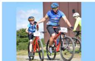
HOBBY NA ČERCHOV - kategorie pro doprovod nejmenších závodníků za 50,- Kč

Datum | Středa | 2.8.2023 - 9:31:58 STUPNO - ZISK TITULU MISTR PKSC