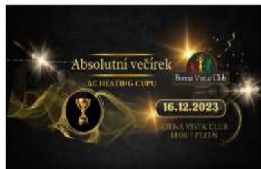
ABSOLUTNÍ VEČÍREK AC HEATING CUP 2023 aneb SLAVNOSTNÍ VYHLÁŠENÍ VÝSLEDKŮ