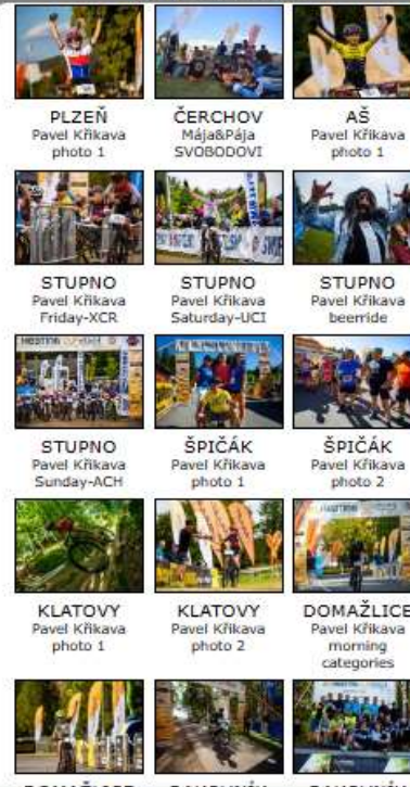
PLZEŇ Pavel Křikava photo 1