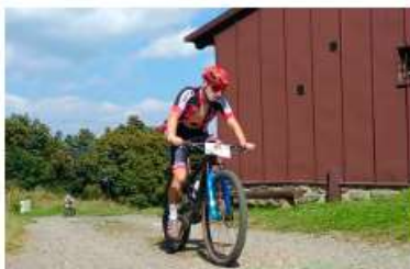
ČERCHOV: výstup na nejvyšší horu Českého lesa zvládlo 119 bikerů a 11 běžců