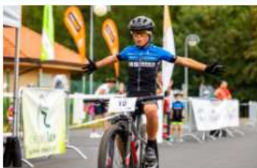
AŠ: STĚNA SMRTI JAKO NEJOBLÍBĚNĚJŠÍ ATRAKCE