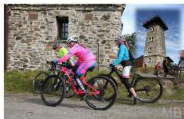
POZVÁNKA NA ČERCHOV - 9. ZÁVOD SERIÁLU AC HEATING CUP