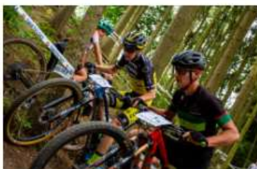
SKVĚLÉ STUPNO: NAVZDORY NEPŘÍZNÍ POČASÍ + výsledky Elite muži UCI C2 + štafety